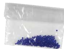
Billes de verre