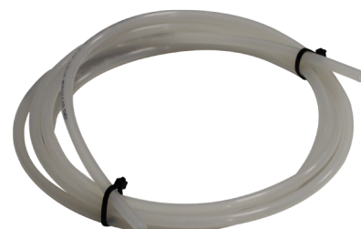
PVDF Spécial chlore